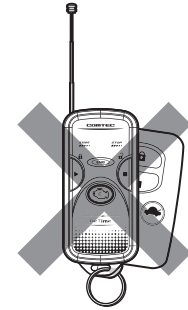
リモコンと純正スマートキーを重ねて使用しない