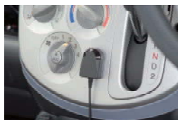
■リモコン受光部取付け例