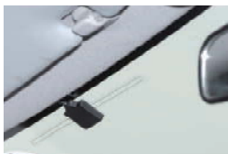
■フィルムアンテナ取付け例