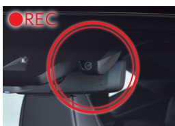
2. デジタルインナーミラーへ電源を供給し、車両の録画機能で映像を記録