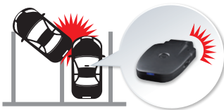
1. 駐車中に本製品が衝撃を検出